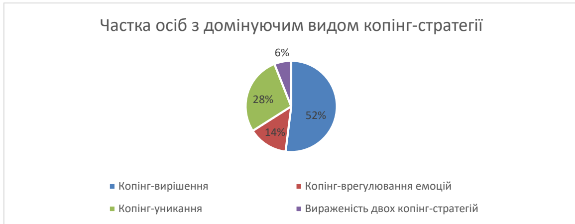
Рис. 1. Узагальнені результати, отримані за допомогою методики «Копінг-поведінка у стресових ситуаціях CISS»

У ході емпіричного дослідження було виявлено домінуючий вид копінгу у студентів (див. рис. 1).